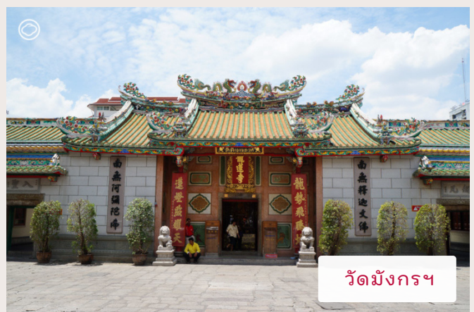
วัดมังกรฯ