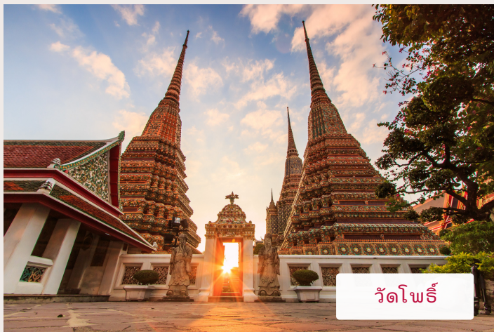
วัดโพธิ์