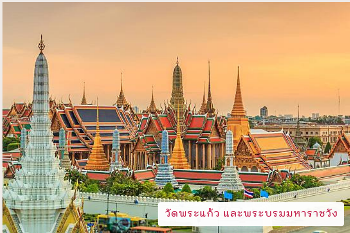
วัดพระแก้ว และพระบรมมหาราชวัง