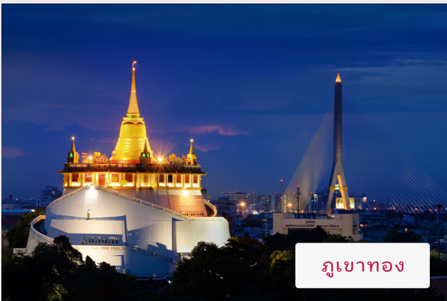
ภูเขาทอง