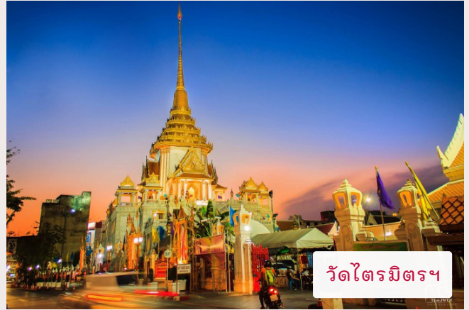
วัดไตรมิตรฯ