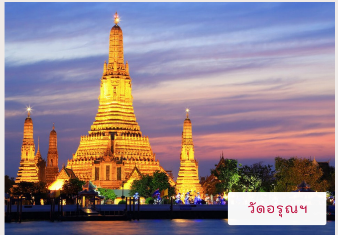
วัดอรุณฯ