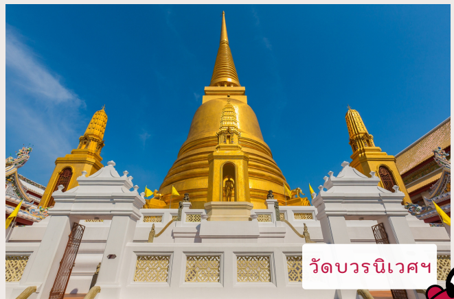
วัดบวรนิเวศฯ