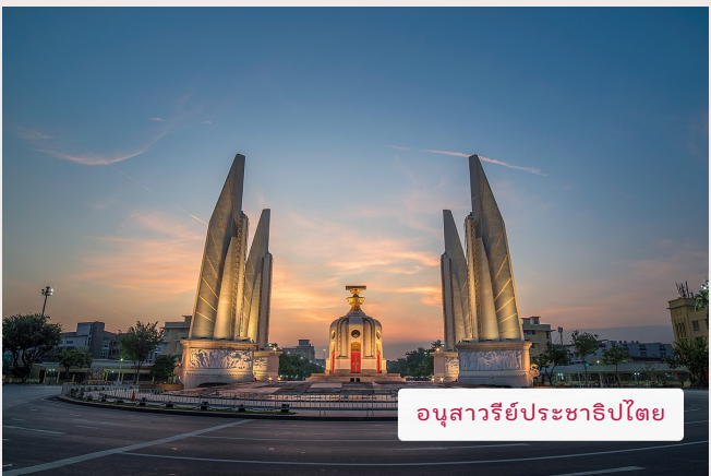
อนุสาวรีย์ประชาธิปไตย