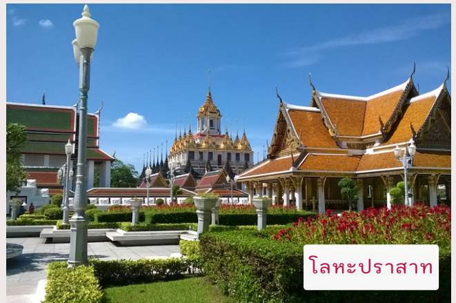
โลหะปราสาท