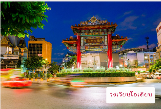
วงเวียนโอเดียน