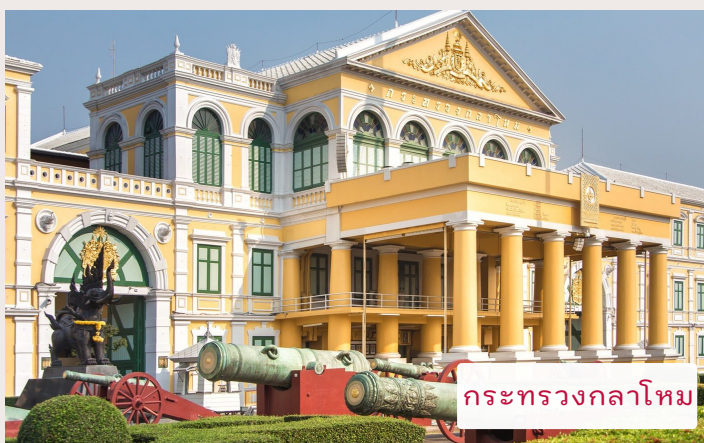
กระทรวงกลาโหม