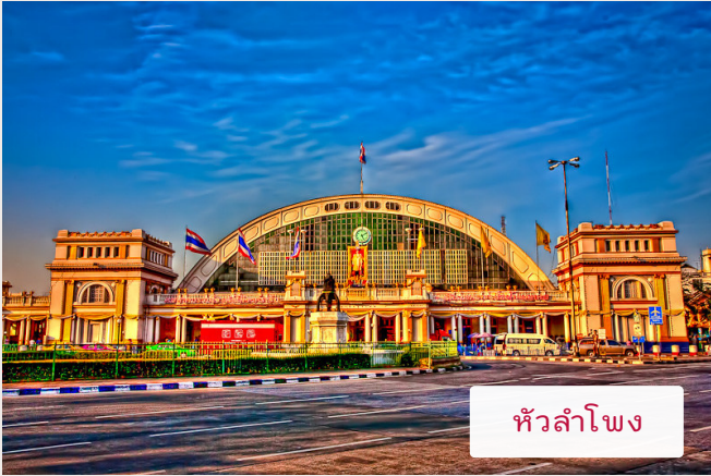
ห้วลำโพง