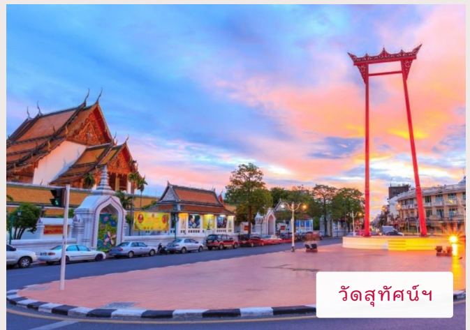
วัดสุทัศน์ฯ