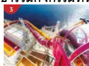
Waterslide Park Get drenched in fun on one of our six different waterslides.