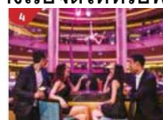
Bar 360 Catch live music and aerial acrobatic performances with a glass of champagne.