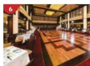
Dream Dining Room Savour a wide variety of Asian and international cuisine.