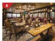
Bistro By Mark Best Relish contemporary Western cuisine from the internationally-acclaimed Australian chef.