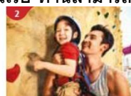
Rock Climbing Wall Challenge yourself on our mountainous rock climbing wall.