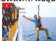
Ropes Course & Zipline Feel the thrill of gliding above the ocean on a 35-metre zipline.

สำหรับท่านที่ประสงค์ที่จะอยู่บนเรือ ท่านสามารถเข้าร่วมกิจกรรมที่ทางเรือจัดให้หรือพักผ่อนได้ตามอัธยาศัย