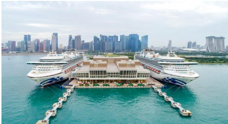
ที่อยู่ท่าเรือ : Marina Coastal Drive #01-01, Singapore 018947

การเดินทางจาก สนามบินชางจี ไปที่ ทำเรือมารีญา เบย์ ครุสเซนเตอร์ สามารถเดินทางด้วย Taxi, จาก สนามบินใช้เวลาประมาณ 30 นาที ค่าใช้จ่ายประมาณ SGD20(500บาท) (ท่านควรมาถึงท่าเรือเพื่อเช็คอินเข้าเรือก่อนอย่างน้อย 3 ชั่วโมง)