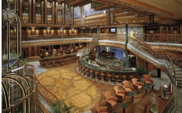
เรือเดินทางต่อสู่มืองเค็ทซิกแกน