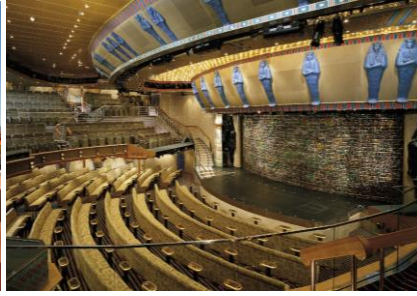
ค่า บริการอาหารมือเท้า ณ ห้องอาหารบนเรือสำราญ พร้อมชมโชว์สุดพิเศษ