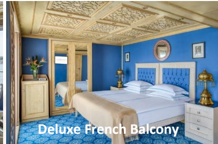
Deluxe French Balcony